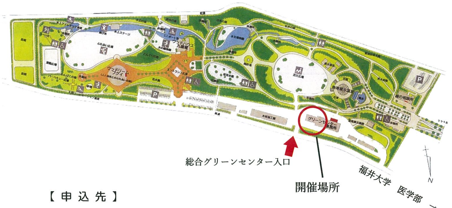
総合グリーンセンター配置図